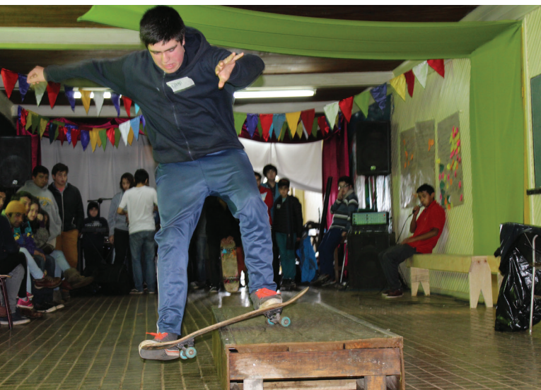
Un estudiante de la Asociación de Skaters de Paillaco muestra sus habilidades a autoridades locales, durante una sesión de Café Mundial realizada en mayo de 2015.

En apoyo a los esfuerzos del CEM hacia la sinergia, es esencial reconocer que esta actitud es una parte inseparable de los sistemas educacionales en los cuales opera el Centro. El aprendizaje y el trabajo desarrollados en forma colaborativa no son características de la vida en Chile, pero son enseñados como los mejores medios para un fin determinado. Por lo tanto, el CEM utiliza distintos métodos educativos para que el personal, los estudiantes y los miembros de la comunidad logren comprometerse uno con otro. Sin embargo, también cuentan con sistemas educativos orientados a proyectos y talleres, los cuales enseñan para luego facilitar procesos de producción de inteligencia colectiva. Este sistema de dos niveles de educación, para la conversación inicial y luego para la creación cooperativa, permite al CEM respetar realmente a individuos y grupos. Construir inteligencia colectiva comienza con saber escuchar, aprender a manejar conflictos, soltar el ego y el miedo, mantenerse curioso y explorar posibilidades, creer que hay suficiente para todos y practicar la flexibilidad. La inteligencia colectiva requiere confianza, y crea un ambiente para que surja la confianza.