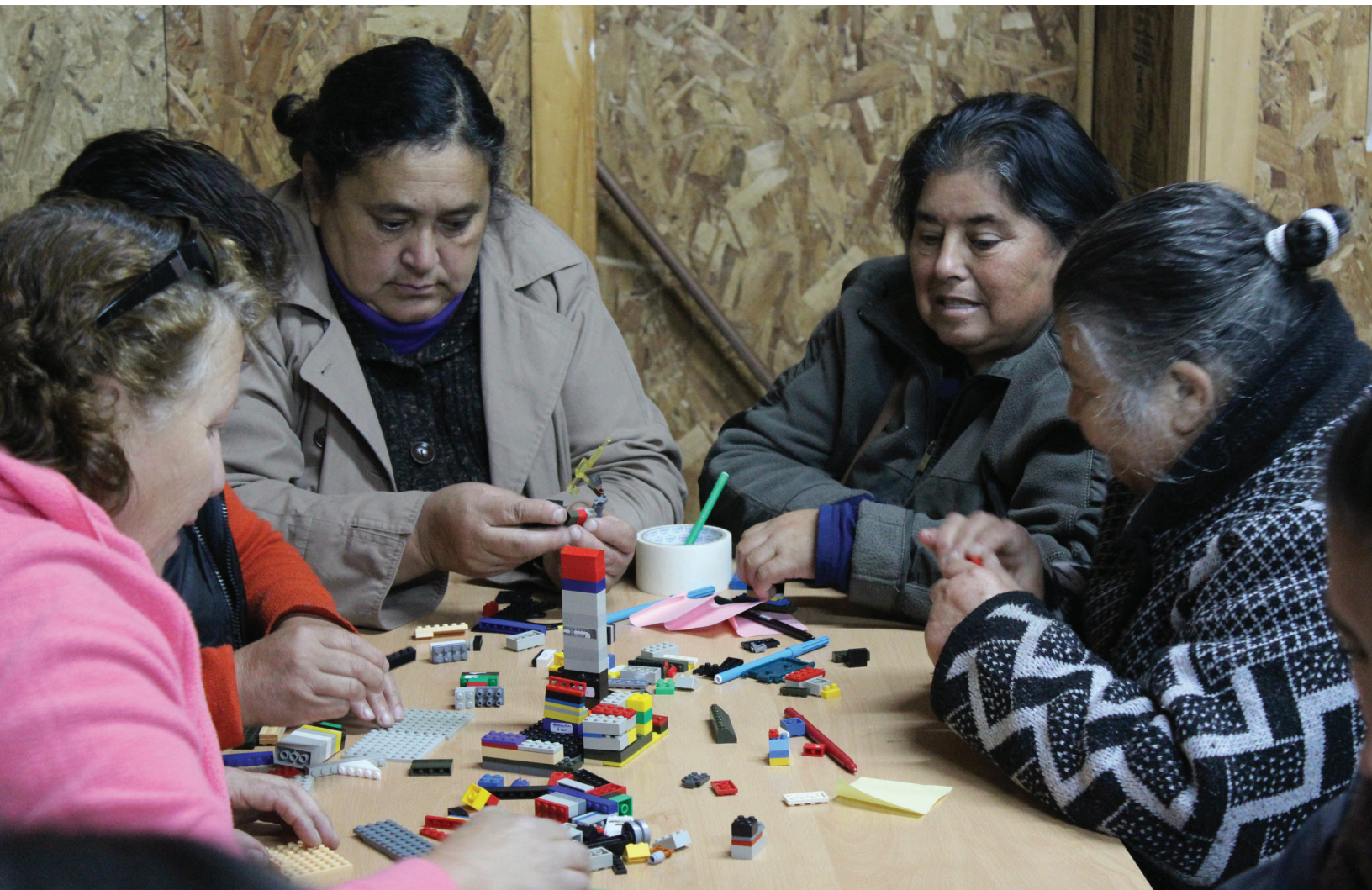
Mujeres de una zona rural usan bloques de Lego para imaginar sus emprendimientos en 5 años a futuro, en septiembre de 2015.