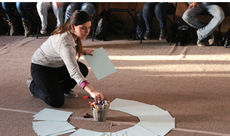
Una mujer participa en una sesión de Café Mundial, en octubre de 2014.

Este estudio comienza con una breve historia de la región, para luego dar el contexto de la historia del CEM y sus cimientos teóricos, como la Teoría del Desarrollo a Escala Humana (DEH) de Manfred Max-Neef. Se detallan algunos de los enfoques y prácticas claves del CEM; también se tratan los desafíos enfrentados por el modelo CEM y se compara el mismo centro con otras iniciativas de compromiso cívico universitario en Latinoamérica. Finalmente, los autores comparten lecciones aprendidas e identifican los principios del modelo CEM, el que los lectores pueden aplicar en sus propias comunidades.