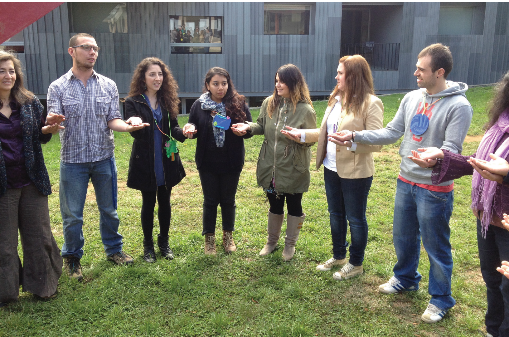
Estudiantes y profesores del CEM se reúnen en las afueras del edificio de la Facultad de Ciencias Económicas y Administrativas de la UACH.